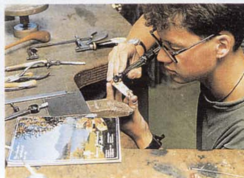
Mit der Politur steht und fällt das Schmuckstück