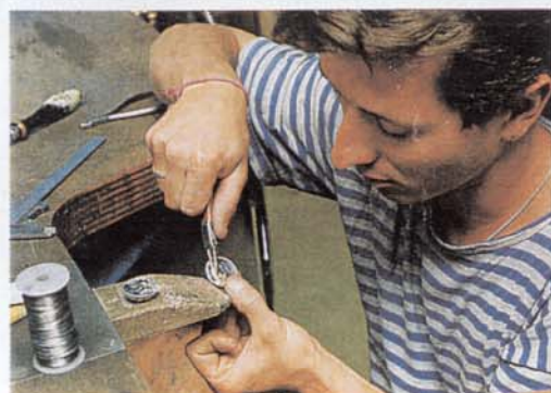
Bei der Montage einer Jagdkrawatte