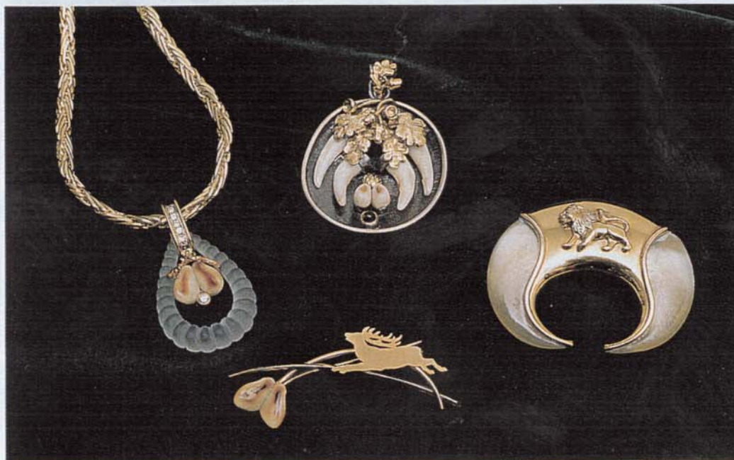
Jede Art von Trophäe, ob Löwe, Fuchs, Wolf, Bär oder Hirsch, wird individuell für den Kunden gestaltet