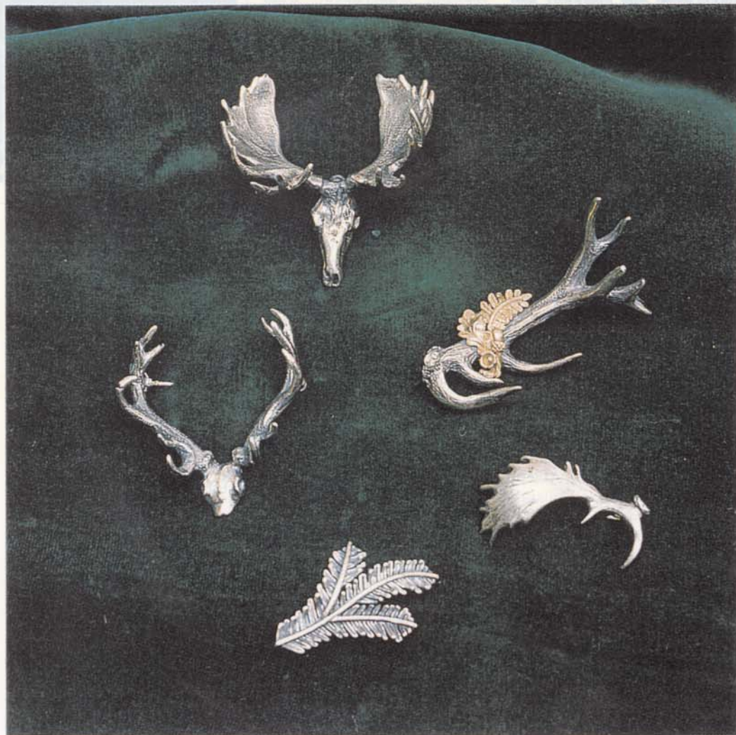
Ob Damhirsch oder Elch, die Auswahl an Hutbroschen ist riesengroß

Ob der Kunde nun auserlesenen Grandelschmuck sucht, ob er sich für eine Hutnadel interessiert, sein Augenmerk auf feines, mit Jagdmotiven versehenes Tafelsilber richtet oder auch nur einen kleinen Knopf erstehen will, in der Tegernseer Goldschmiede Bertele werden auch die ausgefallensten Wünsche preiswert erfüllt. Und auch jemand, der sich nicht nur beraten lassen will, sondern auch einmal einen Blick in die Werkstatt werfen möchte, ist bei Bertele in Tegernsee jederzeit willkommen. □