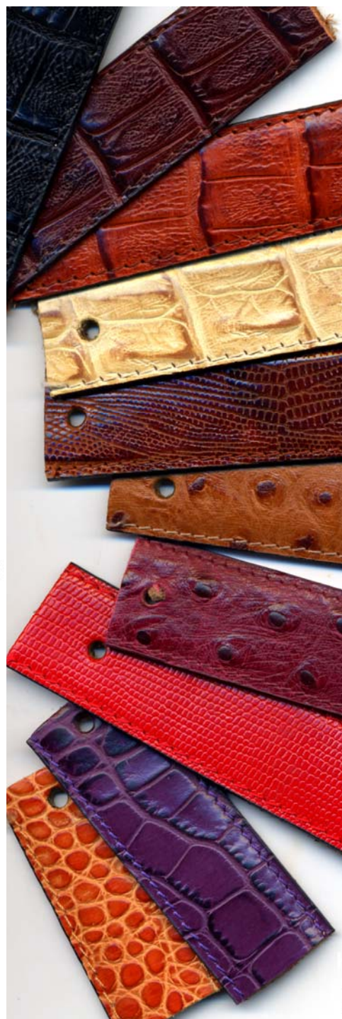
schwarz geprägt d'braun geprägt