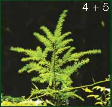
4 + 5

Jagdschmuck vom Jäger für Jäger, in feiner Handarbeit arbeiten wir in unserer Goldschmiedewerkstatt zu allen Trophäen, die Sie uns anliefern.